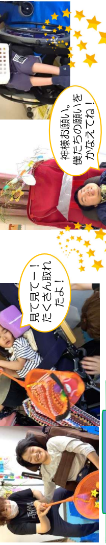
見て見てー！ たくさん取れ たよ！