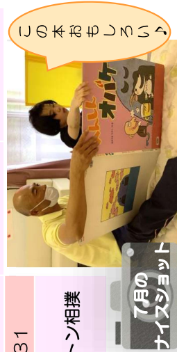
この本おもしろい！